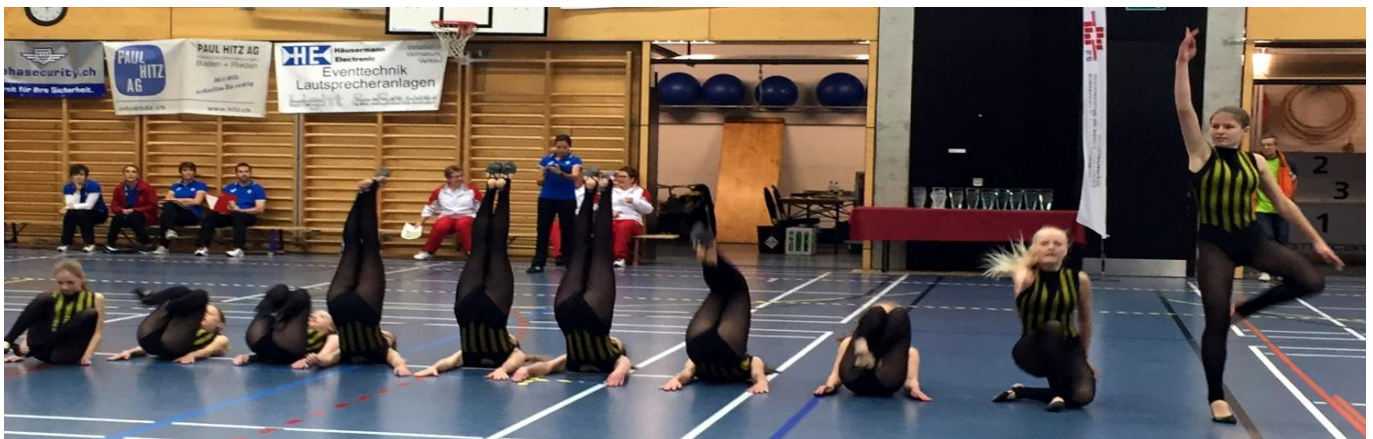
Der lange geübte „Kanon“

Wir freuen uns auf den nächsten Auftritt der Juniorinnen und wünschen ihnen für den nächsten Wettkampf an den Kantonalmeisterschaften Jugend und Aktive am 4./5. Juni 2016 in Gränichen viel Glück und gutes Gelingen! Sie werden sich dort erstmals auch in der Kategorie Aktive mit anderen Vereinen messen.