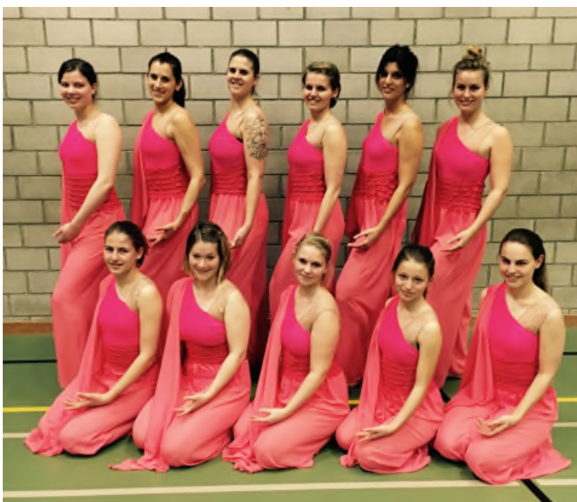
Elf Elfen „En Vogue“

Traditionell im April werden die Gymnastinnen mit den neuen Dress der Saison ausgerüstet. In diesem Jahr wagen die Turnerinnen der Kür ohne Handgerät eine mutige Farbwahl. Sie konnten selber die Farbe des neuen Dress auswählen: Koralle.