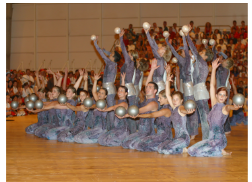
2003 Lissabon (Portugal)

Der DTV Muhen ist seit 1999 jedes Jahr ausnahmslos vertreten. Selbstverständlich ist auch die Teilnahme für 2019 jetzt bereits schon geplant. Bist Du auch dabei?