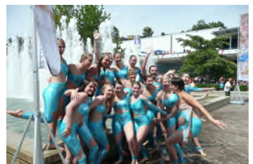
2011 Lausanne (Schweiz)