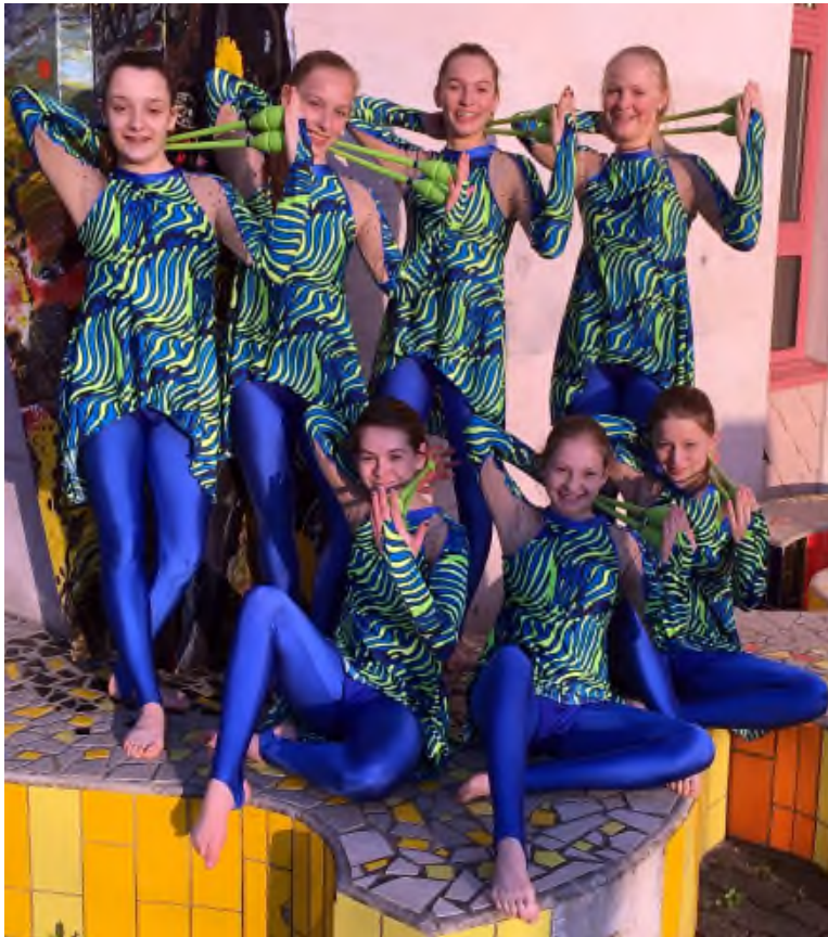
Die Gymnastinnen präsentieren ihr neues Dress.

Diese Frage kann sicherlich jede der acht Keulen-Juniorinnen problemlos beantworten. Es gibt eine Grundregel beim Turnen mit den Gymnastikkeulen: Man schlägt sich prinzipiell nur einmal richtig fest mit der Keule selber an den Kopf!