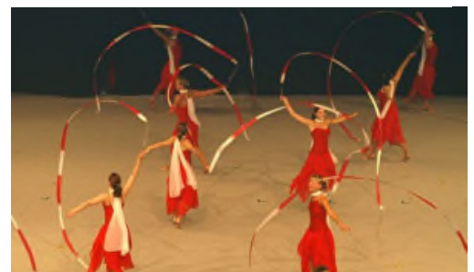
2007 Dornbirn (Österreich)