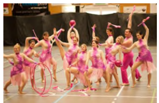
2015 Helsinki (Finnland)